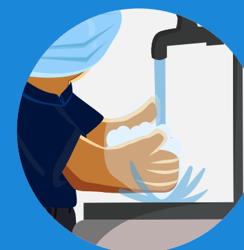
Lavarse las manos