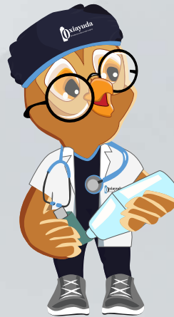
Acoplar el inhalador