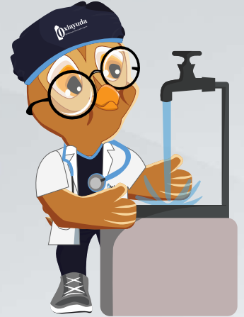
Enjuagar la boca