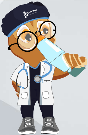
Colocar la boquilla en la boca. Pulsar 1 vez