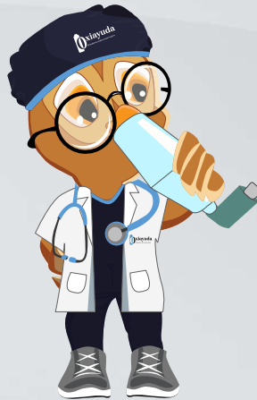
Coger aire lenta y profundamente