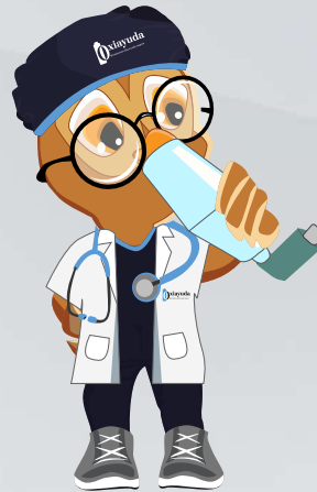
Contar 10 segundos antes de retirar la inhalocámara