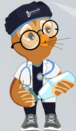
Expulsar el aire