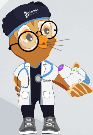
Expulsar el aire