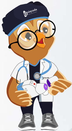
Destapar el inhalador