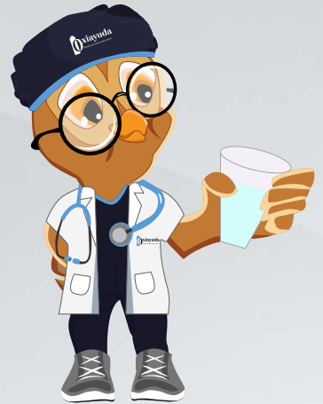
Enjuagar la boca