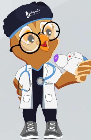
Cargar la dosis