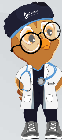
Aguantar la respiración