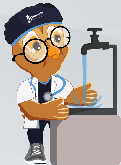
Enjuagar la boca