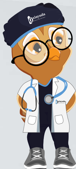
Aguantar la respiración