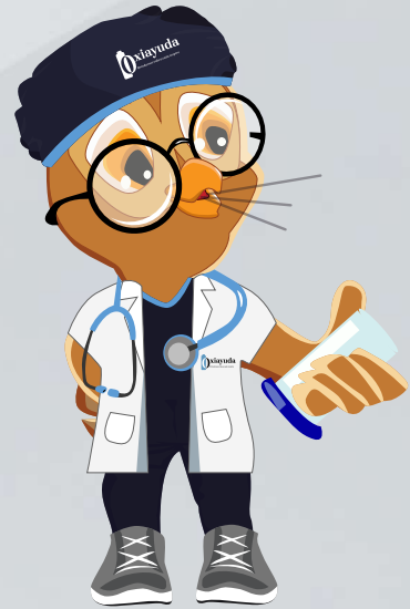
Expulsar el aire