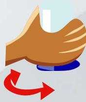
Cargar la dosis