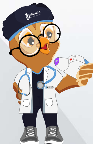
Cargar la dosis