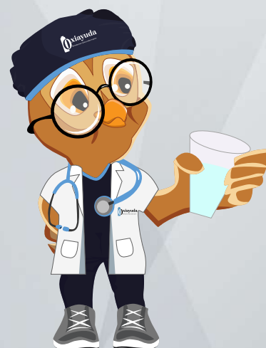
Enjuagar la boca