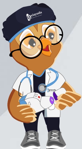
Destapar el inhalador