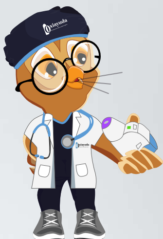
Expulsar el aire