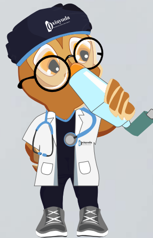
Contar 10 segundos antes de retirar la inhalocámara