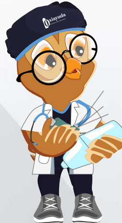
Realizar un puff al aire