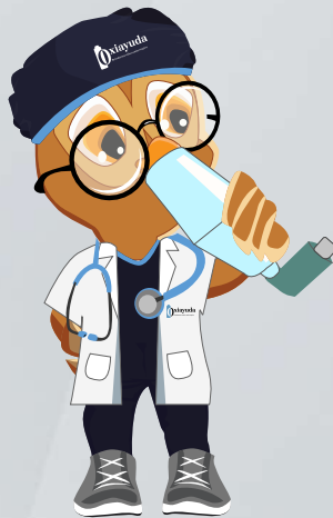
Coger aire lenta y profundamente