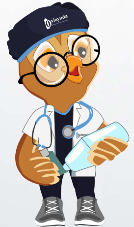
Acoplar el inhalador