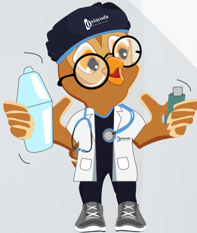
Destapar y agitar vigorosamente el inhalador antes de adaptarlo a la inhalocámara