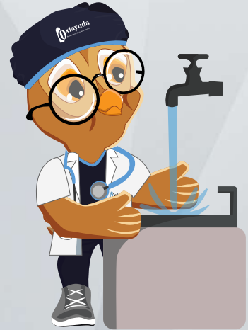
Enjuagar la boca