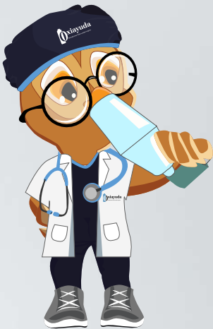
Colocar la boquilla en la boca. Realizar 1 puff y contar 10 seg para realizar el siguiente puff